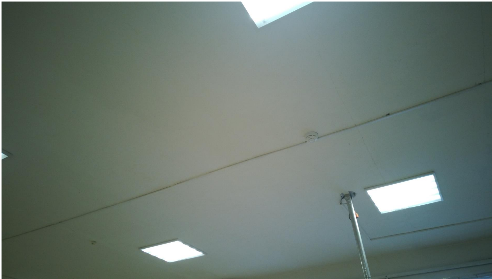
Потолок кабинета № 27 МОУ ООШ №15